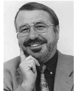
Dr. Georg Ruppelt Sprecher Bibliothek & Information Deutschland